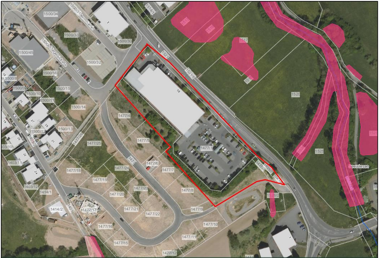
Abb. 1: Lage des Untersuchungsgebiet, ohne Maßstab (Untersuchungsgebiet = rote Markierung); Kartengrundlage: Räumliches Informations- und Planungssystem (RIPS) der LUBW, Amtliche Geobasisdaten © LGL, www.lgl-bw.de, Az.: 2851.9-1/19