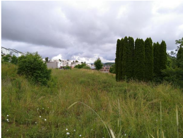
Abb. 4: Ruderalflächen und Ziergehölze