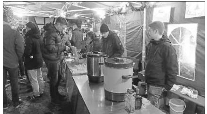
Die MVU Glühweinköche

Am Samstagabend bot sich wie in jedem Jahr am gewohnten Standort die Gelegenheit, miteinander ins Gespräch zu kommen, die weihnachtliche Atmosphäre zu genießen und den aus Württemberger Wein frisch und komplett selbst zubereiteten Glühwein oder leckeren Kinderpunsch zu genießen. Doch auch für Kulinarisches vom Grill war in diesem Jahr wieder bestens mit leckeren Würsten und Steaks vom Schwenkgrill gesorgt.