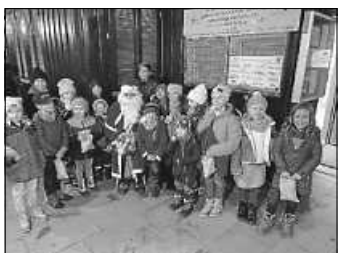
Der Nachwuchs mit dem Nikolaus Fotos: Nikolausfeier 2022