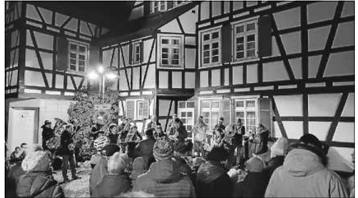
Der MVU sorgte für weihnachtliche Klänge am Weihnachtsmarkt

Auch musikalisch war der Musikverein wieder auf dem Weihnachtsmarkt samstagsabends vertreten. Die wieder zahlreich erschienenen Besucher des Marktes konnten gespannt den weihnachtlichen Klängen der Musikerinnen und Musiker lauschen, während diese altbekannte, traditionelle Weihnachtslieder spielten und zum Mitsingen einluden.