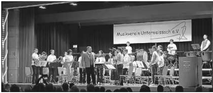
Ein toller musikalischer Nachwuchs – Die MVU-Jugend