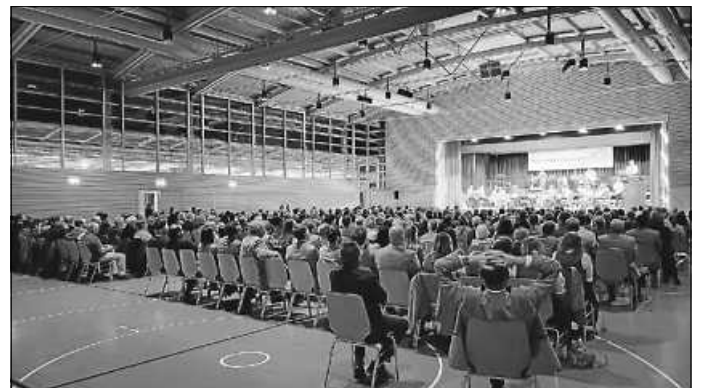
Musikalisch schon ganz groß – Die MVU-Minis in der gut besuchten Seeguthalle

Am 26.11.2022 war es wieder einmal so weit. Der Musikverein Unterweissach lud zu seinem Jahreskonzert ein. Nachdem das diesjährige Frühjahrskonzert Corona bedingt ausfallen musste, machte eine vollbesetzte Seeguthalle deutlich, dass nicht nur die Vorfrende der Musikerinnen und Musiker groß war, sondern auch die der Zuschauerinnen und Zuschauer.